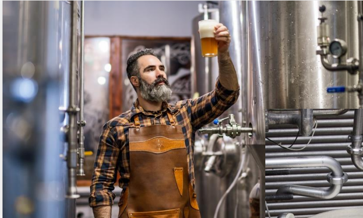
01 Brauerei • flexible & effiziente Umbauten und Reparaturen, Einhaltung hoher Hygienestandards