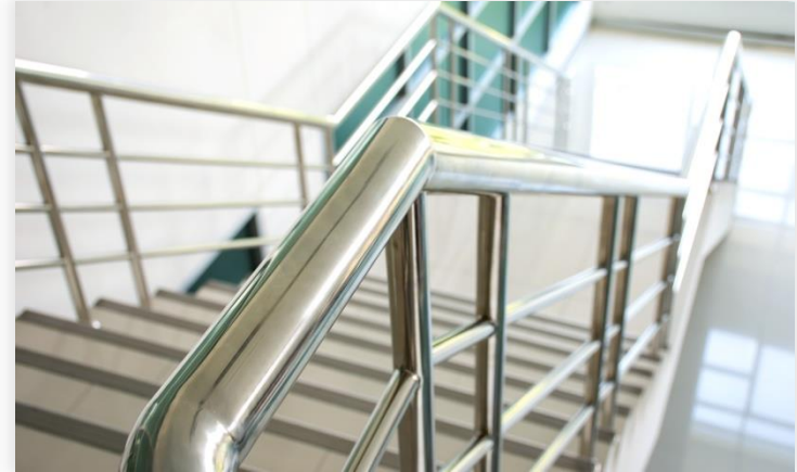
03 Geländerbau • ästhetischer Anspruch, Einhaltung von Sicherheitsstandards und gleichmäßige Reproduzierbarkeit