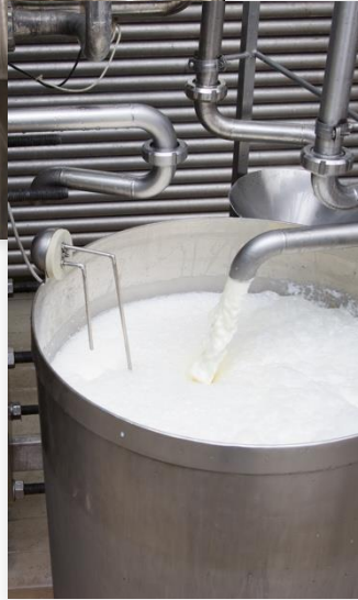
02 Molkerei • Etablierung von molchbaren Rohrsystemen durch qualitativ hochwertige Schweißnähte